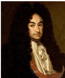
Der Universalgelehrte Gottfried Wilhelm Leibniz ist der Namenspatron unserer Schule